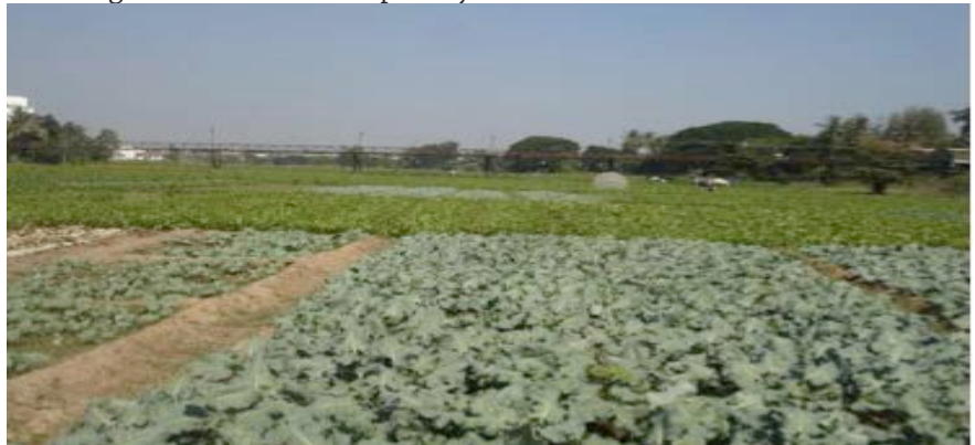
What Don Chan used to look like before construction of villas, farming community supplying food to Vientiane local food markets.

Agreeing to take us to the resettlement site – located 26km