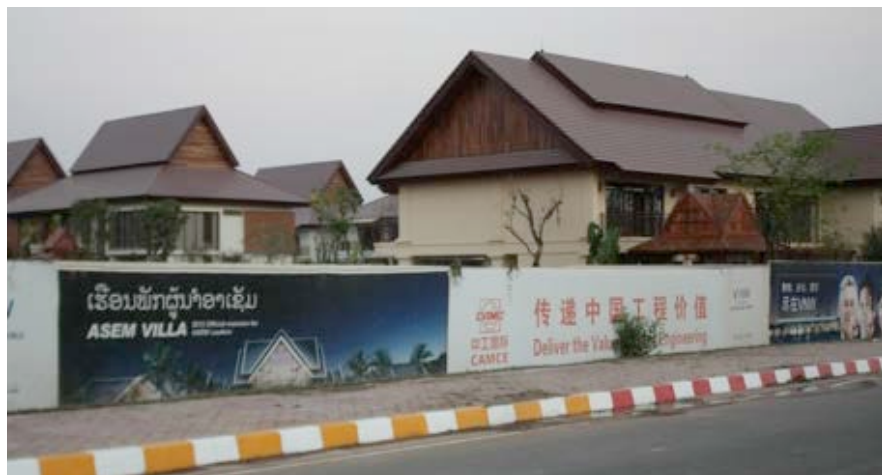
Villas in real life, October 2012

under the initiative “Plant rubber to replace poppy” - a Lao government policy to eradicate opium. Due to the imbalance of power and lack of access to information, the farmers provided free labour and transferred half of their land (with the rubber trees) to the company. They now cannot leave the village/plantation as the area is physically enclosed and guarded.