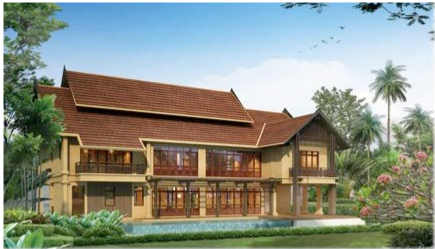
Website advertisement of the luxury villas hosting the ASEM9 delegates

Moving on, we attempt to visit a Chinese rubber plantation project, Công ty cao su, a few dozens of km away in Phongsaly. The tense situation over there – with several villagers jailed for protesting – prevents us however from getting too close. From what we are able to gather, this Chinese company together with the district authorities “convinced” the villagers to plant rubber as an effective way of generating cash revenues. They operate